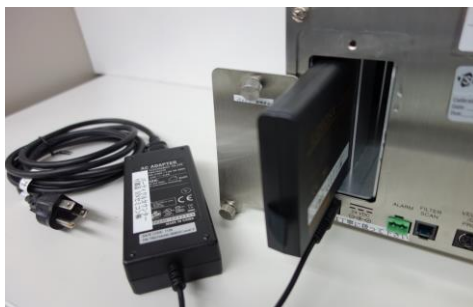
※写真は 9310 です