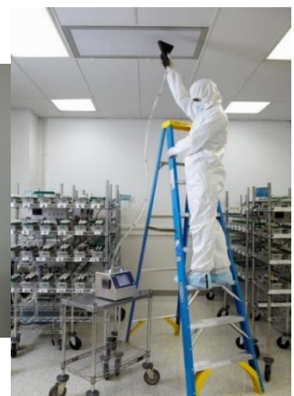
※写真は 9310 です